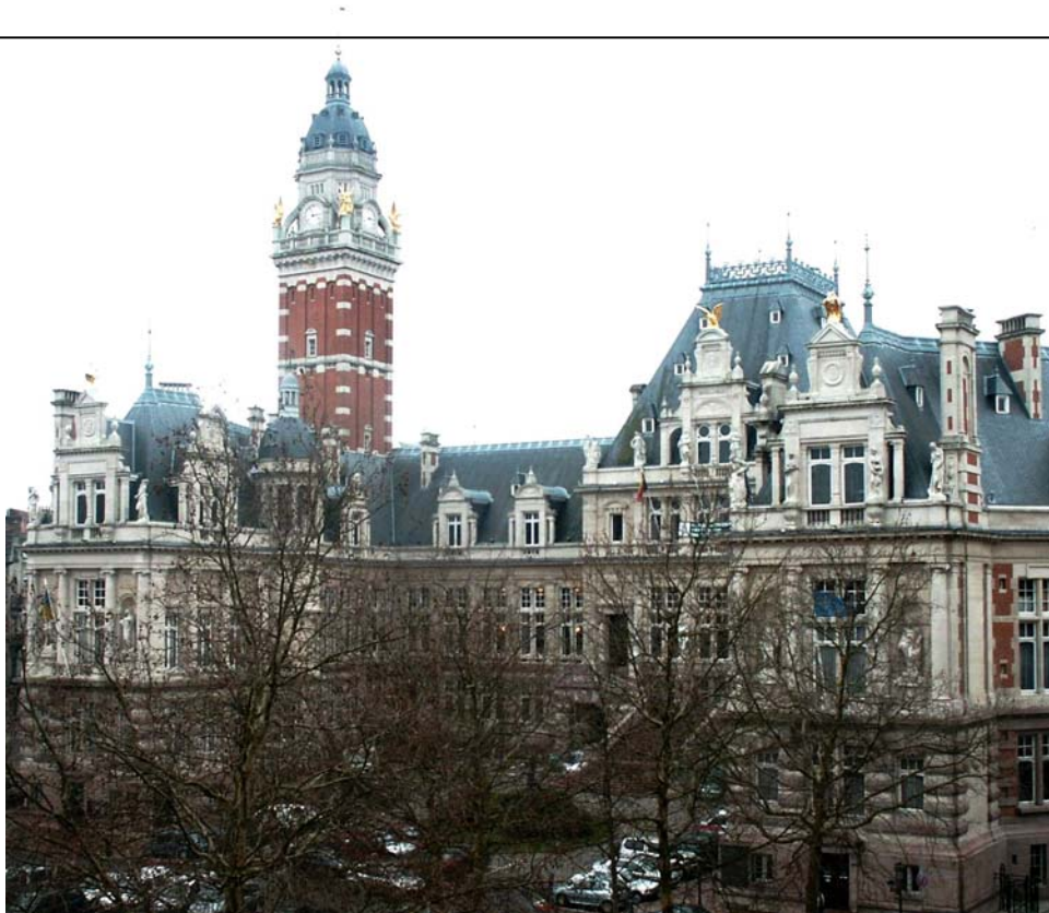
Stadhuis van Sint-Gillis, Maurice Van Meenenpl. 39.