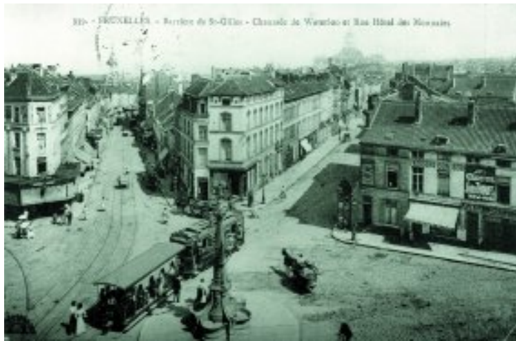
De Bareel van Sint-Gillis (CHDStG, I. 55)

Vanaf de Bareel waaieren de straten uit tussen de driehoek gevormd door de Alsebergse- en Waterloo-sesteenweg en de gevangenis van Sint-Gillis (1878-1884).