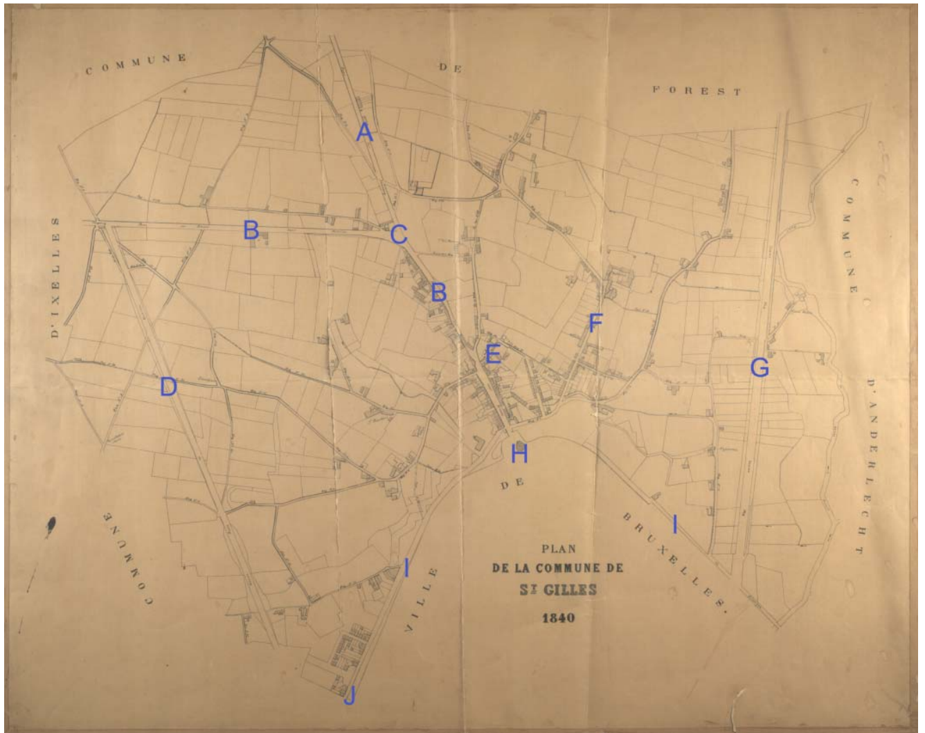
Plan van de gemeente Sint-Gillis, ca 1840 (GASG/OW niet geklasseerd fonds).

Naast de landelijke bebouwing die zonder enige vorm van planning tot ontwikkeling kwam, merken we op het plan van 1840 reeds de eerste elementen van een gestructureerde stedenbouwkundige ontwikkeling: de Louizapoort (J), ontworpen volgens de plannen van de stedenbouwkundige Charles Vanderstraeten en de Charleroisesteenweg (D), ingehuldigd in 1843.