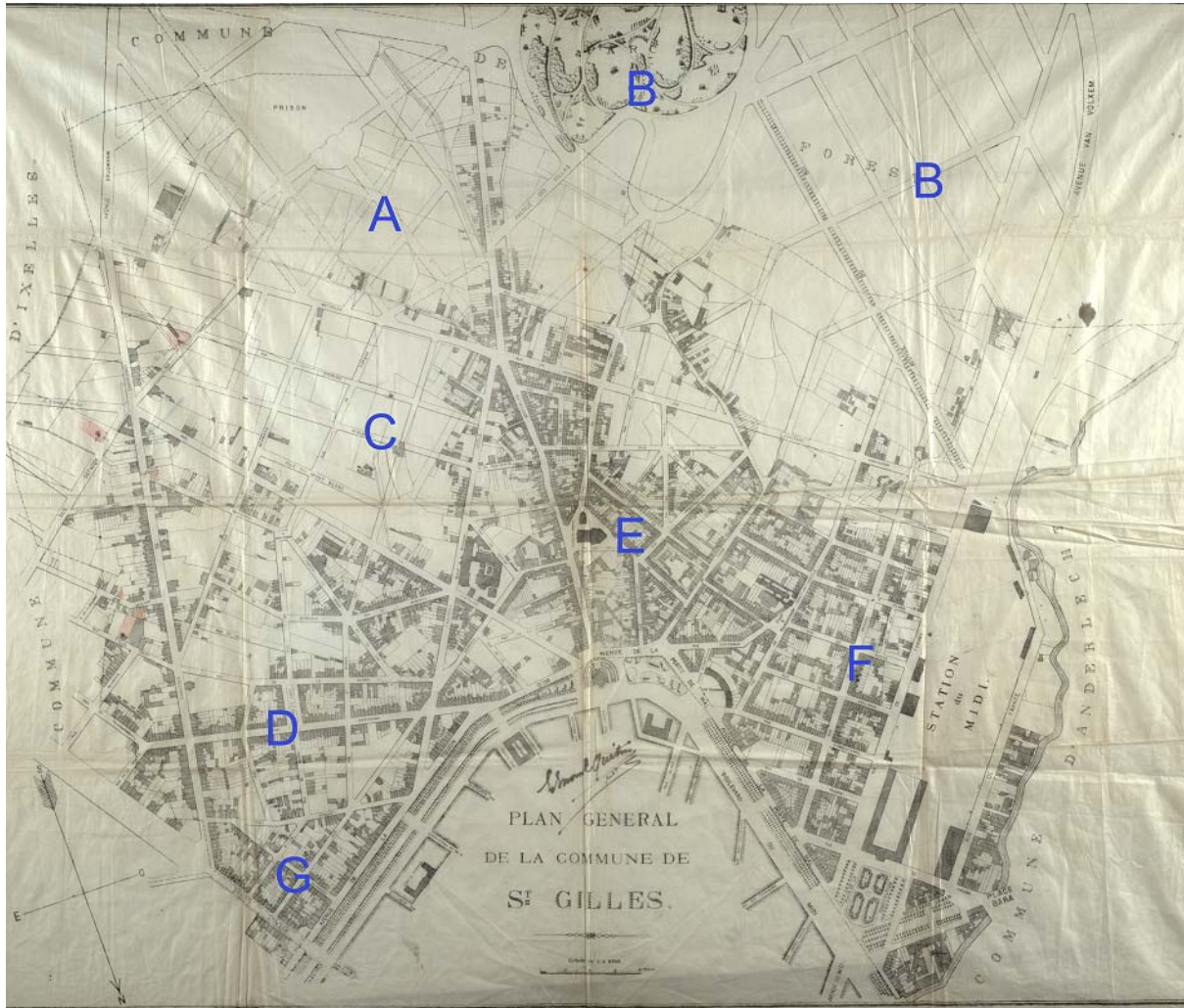
Plan van Sint-Gillis, ca 1880.

Vanaf de jaren 1860 komt de stedenbouwkundige ontwikkeling in een stroomversnelling. Tegen 1880 is de noordelijke helft van de gemeente langsheen de ringlanen bijna volgebouwd. Deze eerste grote bouwcampagne is, dankzij de toepassing van de heersende neoclassicistische stijl, gekenmerkt door een grote homogeniteit.