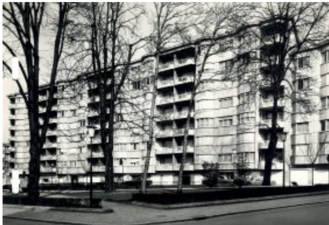
Baron Bouviersquare.

Tijdens het Interbellum verrijzen op de resterende bouwgronden, vaak hoekpercelen, gebouwen met verschillende bouwhoogtes. Binnen dezelfde periode worden tevens sociale woningen gebouwd. Een schoolvoorbeeld bevindt zich in de Bosniëstraat en is in 1922 ontworpen door architect Joseph Diongre. In het hoger gelegen deel van de gemeente worden enkele luxueuze appartementsgebouwen opgetrokken voor de gegoede klasse 7 , aangetrokken door het comfort van het appartement.