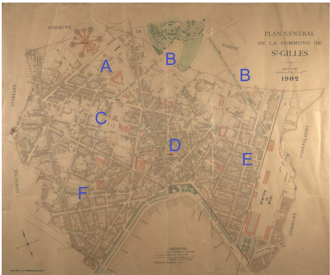
Plan van Sint-Gillis, 1902.

Rond 1902 zijn onbebouwde percelen in de Louizawijk (F), de Centrumwijk (D) en de Stationswijk (E) dan wel schaars geworden, maar nieuwe ontginningen langs de nieuwste verkeersaders van Sint-Gillis dienen zich aan. Rond de eeuwwisseling ontstaan daar nieuwe wijken waar individuele burgerwoningen hoofdzakelijk in eclectische stijl de hoofdtoon voeren.