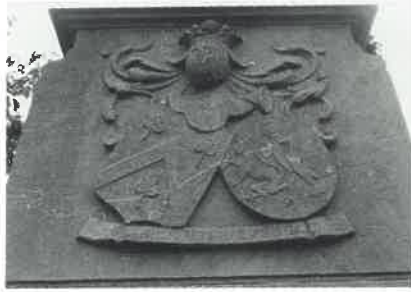
A. 1919 Familles IWEINS de WAVRANS. Armorial, p. 420. Ill. pl. 257-258 n° 1290 à 1292. D. Semper ubique fidelis.