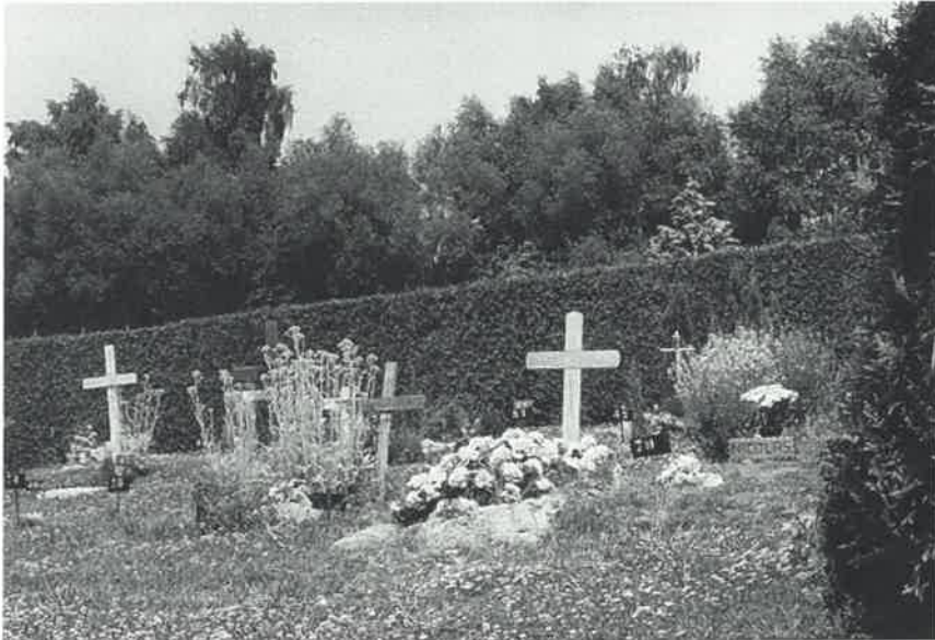
La pelouse des enfants

Le souvenir est une fleur qui ne veut pas mourir