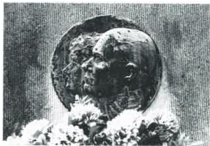
S. pel. I Epit. Le général SMITS-DE BLENDE Le général Pierre SMITS est né le 1er novembre 1868 et est décédé le 5 octobre 1951. Son épouse DE BLENDE Joséphine est née le 27 octobre 1891 et est décédée le 10 décembre 1948. Les époux sont représentés en double profil à gauche. Sign. le long du bord à droite: G. FISCHWEILER. 1950.