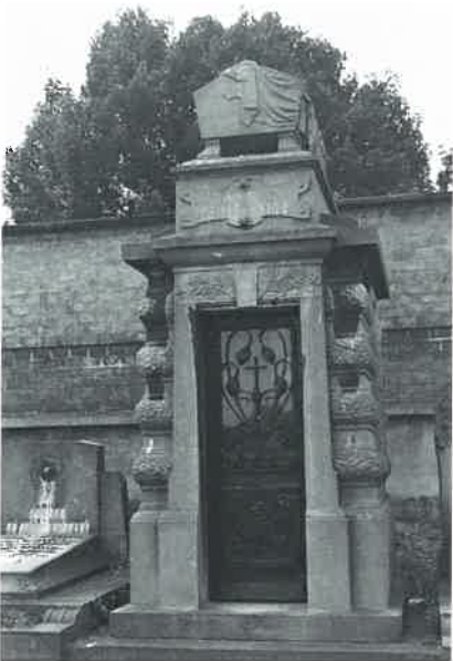
Epit. Sépulture de la famille SOHIE-VAN- DERBORCHT Cippe surmonté d'une urne, à droite sur la photo.

Sanctuaire pour les familles COUDER et MICHEZ.