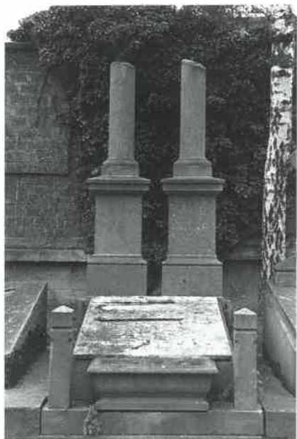
Colonnes brisées. Année: environ 1885