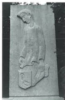
Monument aux Jettois fusillés entre 1940 et 1945

S. près de l'entrée principale à gauche.