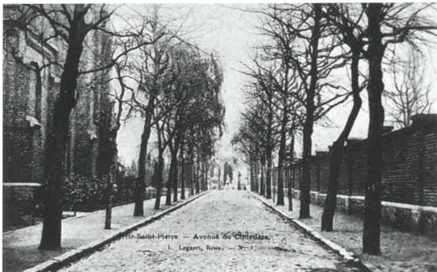
L'avenue du cimetière aboutit, entre deux rangées de marronniers, au lieu du dernier repos.