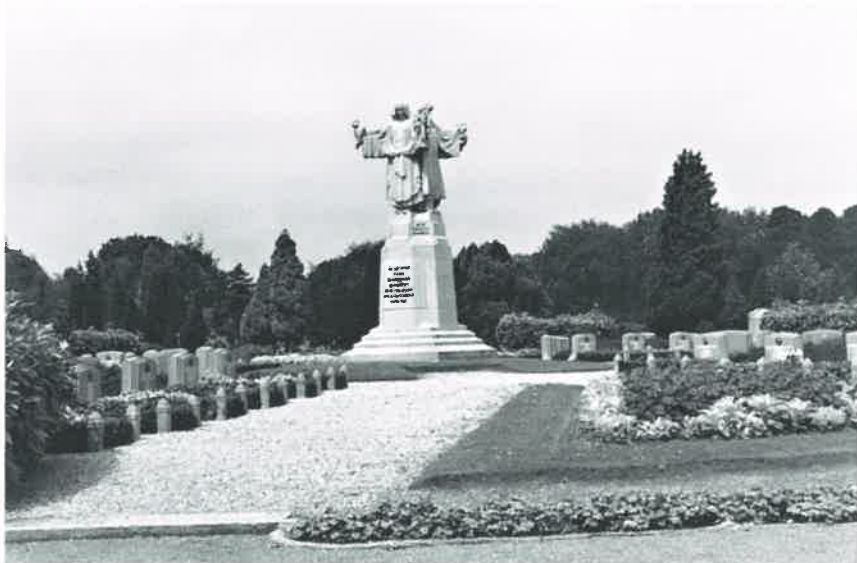
Monument aux soldats tombés pendant la guerre 1914-1918