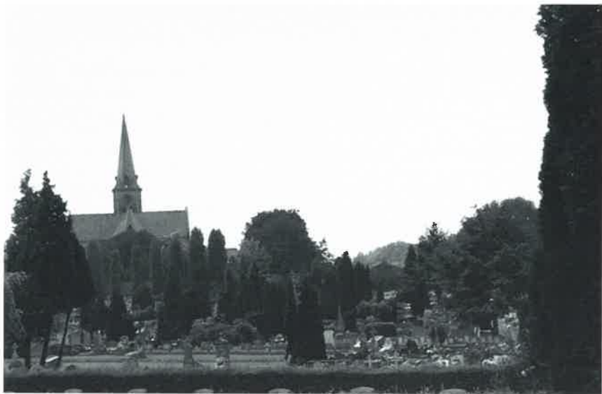
Vue générale du champ de repos.