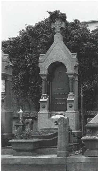
S. av. A. C. La Famille van UYTBERGEN, de CAMPOS NAVARRO et d'ANDRADE Rietstap, T. I, p. 47 (Andrade). T.I, p. 363 (de Campos Navarro).